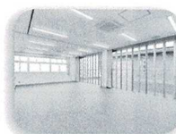
海が見える 研修室(2階)