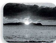
うみてらすから見た海(日の出)