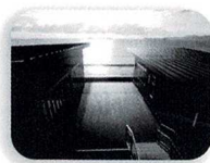
うみてらす展望台(2階)